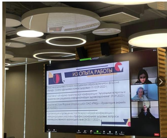
Итоговая аттестация слушателей программы профессиональной переподготовки «Психологическая служба образовательной организации высшего образования: современные подходы и технологии»

Начало занятий по Программе 03 октября 2022 года. Первый, второй и третий учебные модули реализуются в дистанционном формате. Четвертый учебный модуль, включающий консультационную практику и защиту итоговой аттестационной работы, состоится в очном формате на базе Российской академии образования по адресу: г. Москва, ул. Погодинская, д. 8.