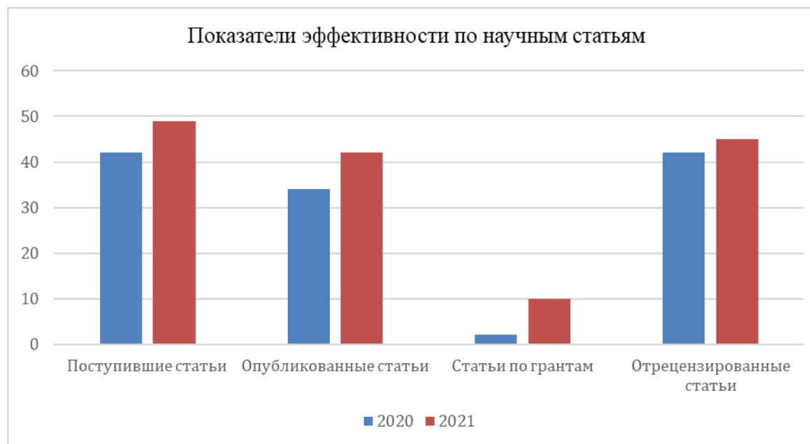
Рис.1. Показатели динамики редакционного портфеля 2020-2021 гг.

За отчетный период увеличились все показатели эффективности издания «Вестник практической психологии образования» по сравнению с предыдущим годом (см. рис. 1). Во многом этому послужило позиционирование журнала, как информационной площадки всех значимых проектов ФПОР.