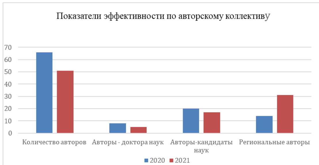
Рис. 2. Динамика показателей авторского коллектива 2020-2021 гг.

За отчетный период произошли изменения эффективности издания «Вестник практической психологии образования» по авторскому коллективу по сравнению с предыдущим годом (см. рис. 2). Понизилось количество опубликованных авторов, авторов кандидатов и докторов наук. Увеличилось количество региональных авторов.