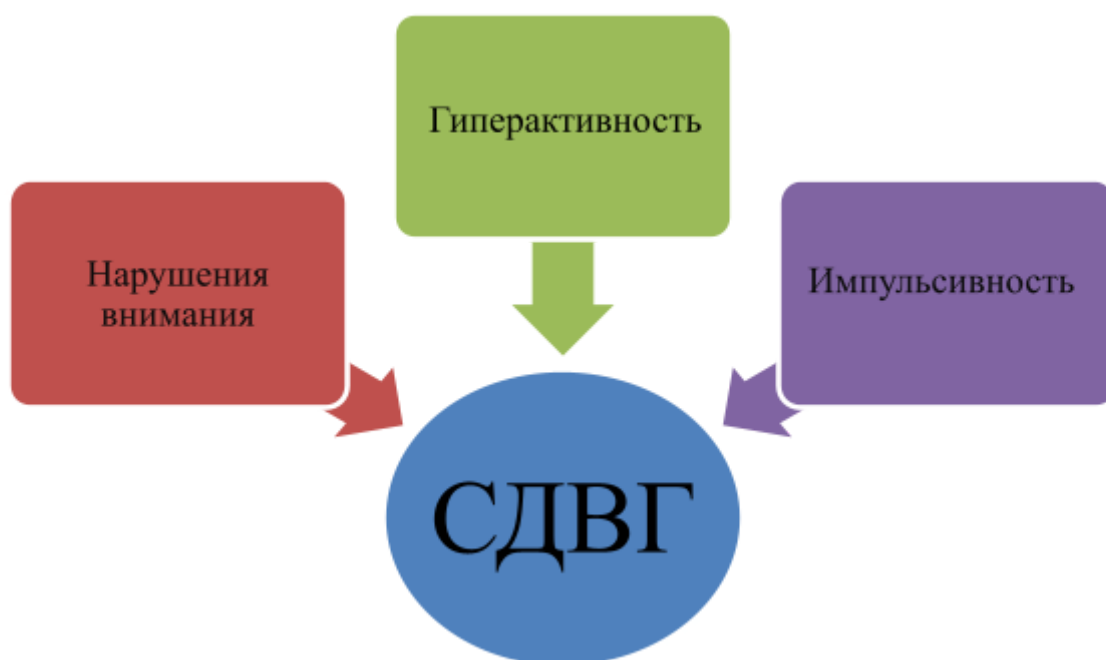
Рис. 3. Симптомы синдрома дефицита внимания и гиперактивности (СДВГ).1

Любому педагогу в практике хотя бы несколько раз встречался ребенок, про которого можно было сказать, что он «считает ворон», «ни минуты не может сидеть спокойно», «не знает элементарных правил поведения», «не слышит, что ему говорят» и тому подобное. Такие дети во время урока без конца чем-то шуршат, выкрикивают с места, отвлекаются на любой звук, качаются на стуле (и даже иногда падают со стула на пол), смеются без повода, болтают или дерутся с одноклассниками. Действительно, среди основных черт, присущих детям с СДВГ, специалисты обычно называют отвлекаемость, импульсивность, рискованное поведение, иррациональное мышление и гиперактивность. Симптомы СДВГ можно разделить на три основные группы, представленные на схеме (рис. 3).