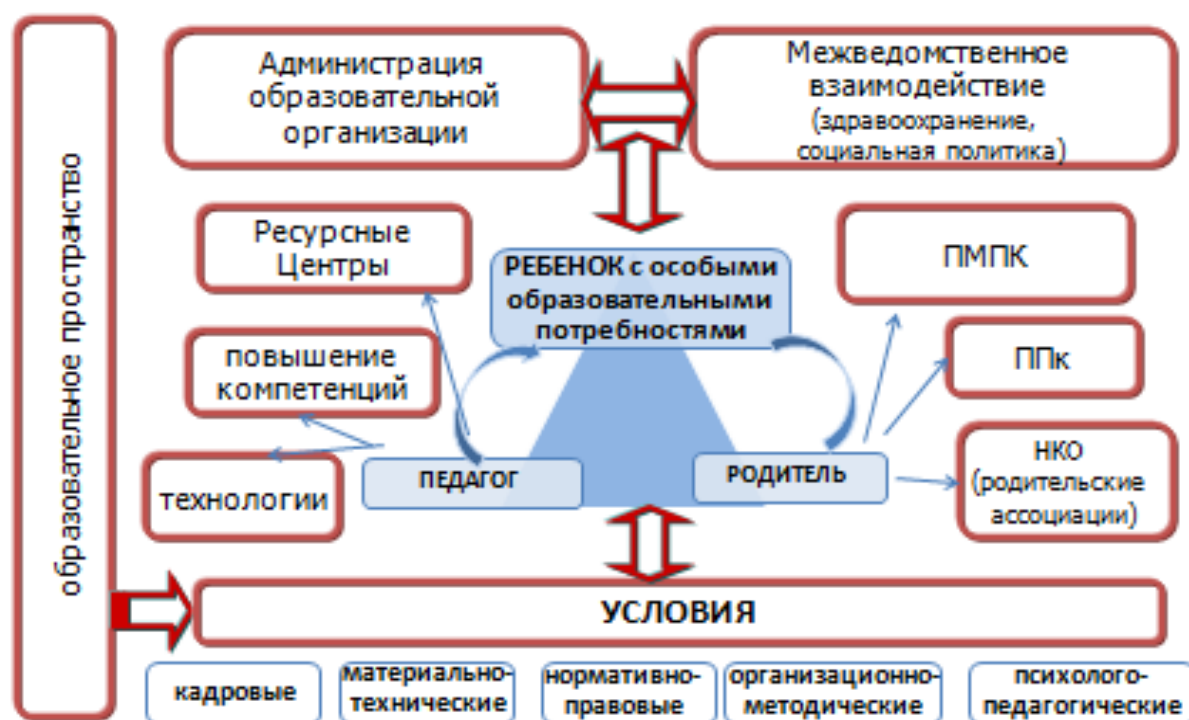
Рис. 2. Модель построения дружелюбной среды в образовательной организации

Модель построения дружелюбной среды в образовательной организации представлена на рисунке 2.