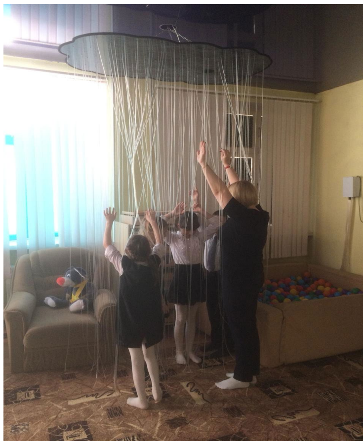
Занятие по теме: «Морская прогулка»