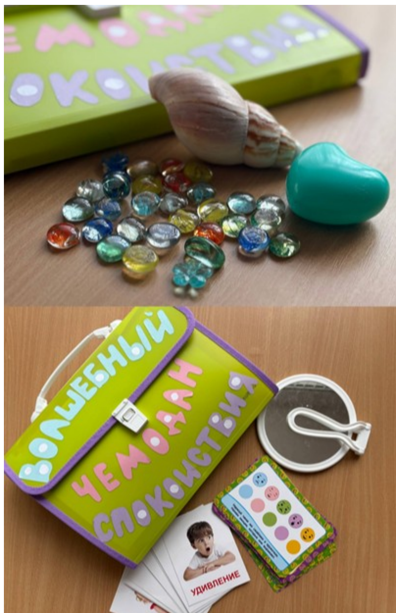
Рис.3. Примерное содержание отделений «Эмоции», «Доброта».