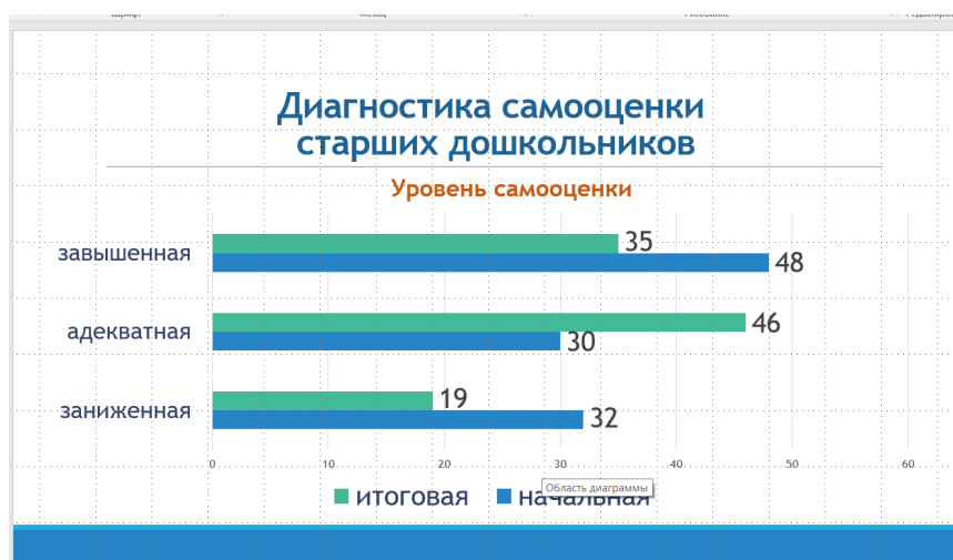
Рис. 3 - Динамика самооценки старших дошкольников

В результате апробации и внедрения Программы мы наблюдаем положительную динамику в показателях адекватной самооценки и тревожности у дошкольников 5-7 летнего возраста, родители которых принимали участие в Программе (рис. 3, рис. 4).