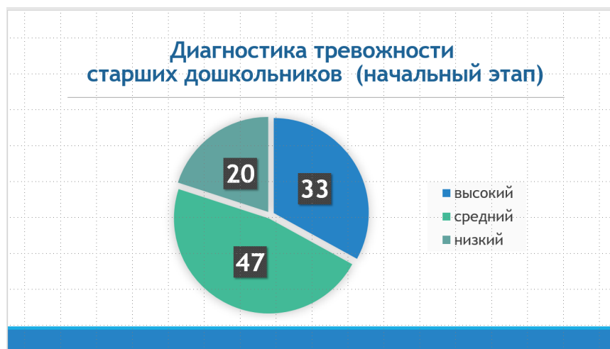
Рис.2 – Диагностика тревожности старших дошкольников (начальный этап)

В результате апробации и внедрения Программы мы наблюдаем положительную динамику в показателях адекватной самооценки и тревожности у дошкольников 5-7 летнего возраста, родители которых принимали участие в Программе (рис. 3, рис. 4).