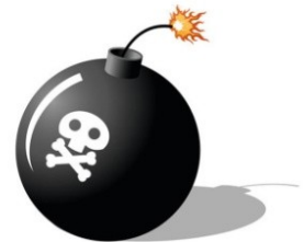
Рис.2. Сектор «Бомба»

Сектор «Бомба» (рис. 2) представлен внутриличностными конфликтами. Соответственно, если участник попадает на него, то тянет карту из колоды и объясняет возможные способы разрешения конфликта.