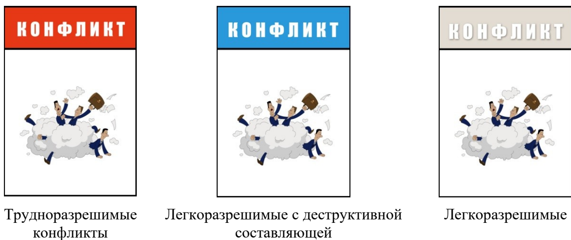
Рис.3. Карты с конфликтными ситуациями

Данный сектор представлен в трёх цветах в зависимости от остроты противоречий в описанной межличностного конфликта (рис.3). Красный сектор представляет трудноразрешимые конфликты, голубой – легко разрешимые с деструктивной составляющей, серый – легко разрешимые.